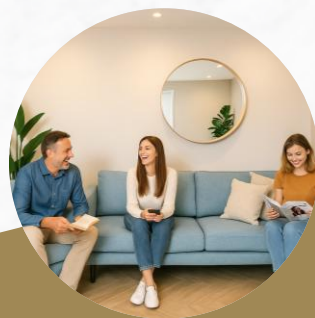
Ambiente acolhedor e descontraído