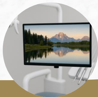
Televisão para pacientes durante atendimento